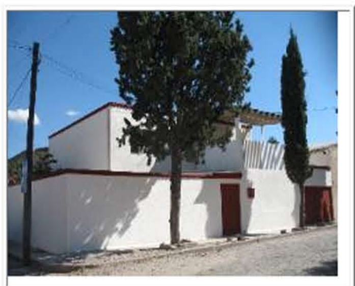
Vista desde la calle

INFORMES EN LA MUEBLERA DE SANTIAGO TELEFONO: 674-862-0054 DESDE USA MARCANDO 01152-674-86-20054 Escriba a ruth@chagocity.com