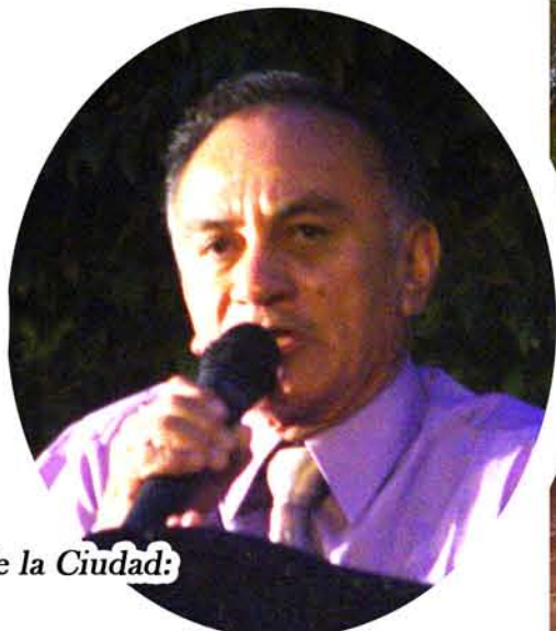
Cronistas de la Ciudad: