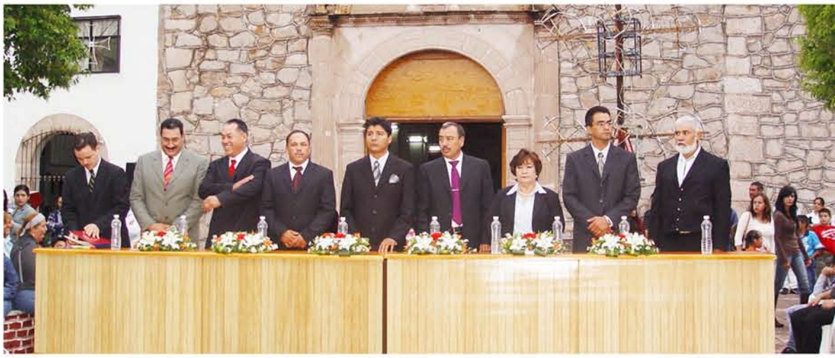
Integrantes del presídium que presenciaron el acto de la escenificación de la fundación de Santiago Papasquiario.

Muchas personas de Santiago Papasquiario emigran o han emigrado a los Estados Unidos de América y en concreto muchas de ellas viven en el área metropolitana de Chicago (Illinois). Chicago tiene una amplia comunidad mexicana de Durango y un número muy significativo provienen de Santiago Papasquiario.